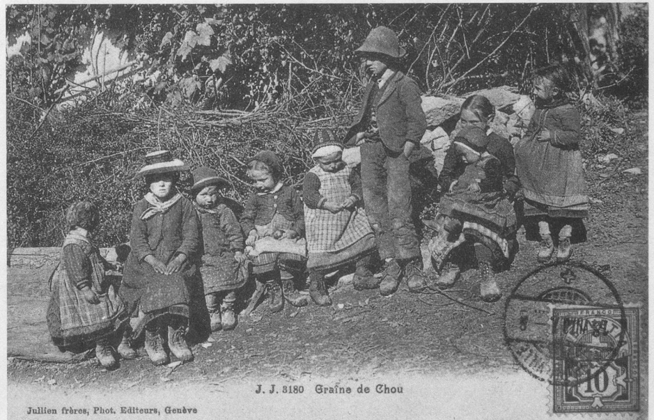
J. J. 8180 Graine de Chou

(Documents extraits de la collection de M. J.-P. Cuendet, rue de la Gare 1, 1162 Saint-Prex).