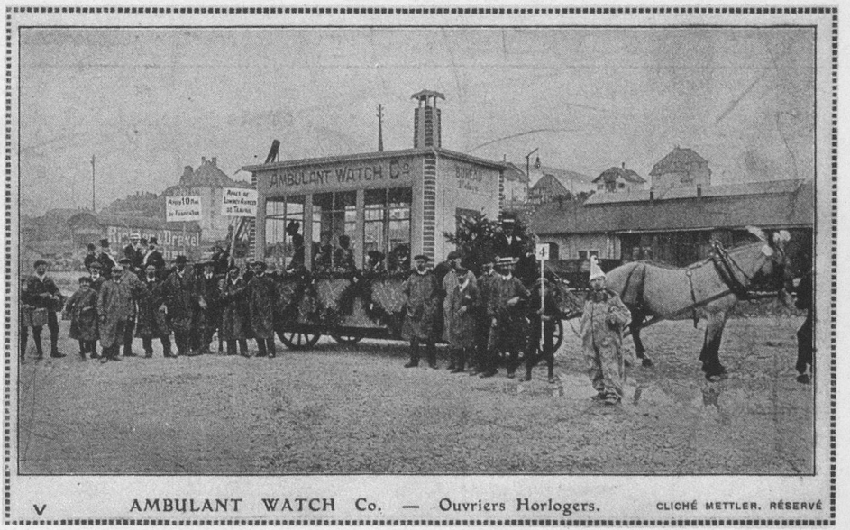
AMBULANT WATCH Co. — Ouvriers Horlogers. CLICHÉ METTLER, RÉSERVÉ

(Cartes extraites de la collection de M. J.-P. Cuendet, rue de la Gare 1, 1162 St-Prex)