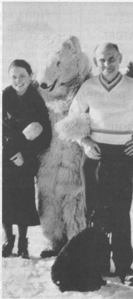
Réhabilité, un homme heureux aux sports d'hiver.

L'ancien bagnard reprend son souffle. Il en est à l'aube de la deuxième grande période de sa vie, celle couleur de ciel. «Dans mes cellules, la souffrance m'avait amené à réfléchir. Une question me taraudait l'esprit: pourquoi étais-je si malheureux? Je me trouvais mille excuses... Il y eut ce que j'appelle le miracle. En prison, j'avais vaguement entendu parler de la Bible. Cela m'avait intéressé sans plus. J'étais bien décidé à ne pas changer, mais je n'oubliais jamais de demander à participer au culte. Devenu bagnard à 30 ans, condamné à perpétuité, j'étais persuadé que ma vie était fichue. Quand on a faim, le cerveau travaille... J'étais désespéré. Un jour j'ai demandé aux Détenus libérés un Nouveau Testament. J'ai lu, mais je n'ai pas très bien compris. Dans mon désarroi je me suis mis à prier. J'ai très vite dû admettre que j'étais coupable. A Riom j'avais pu échanger un paquet de tabac contre une Bible. Peu à peu la haine qui m'habitait s'est évanouie. L'amour est venu, pour les copains d'abord... J'étais fumeur, je leur ai donné mon tabac, ma montre. J'apprenais à aimer et j'étais enfin heureux...»