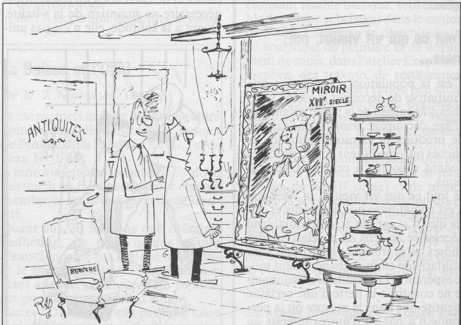
— Comme vous pouvez vous rendre compte, il est d'époque... (Dessin de Rad-Cosmopress)

Ce document peut être obtenu gratuitement à l'Agence communale d'assurances sociales, place Chauderon 9, 1000 Lausanne 9, tél. 43 11 11 interne 73 00.