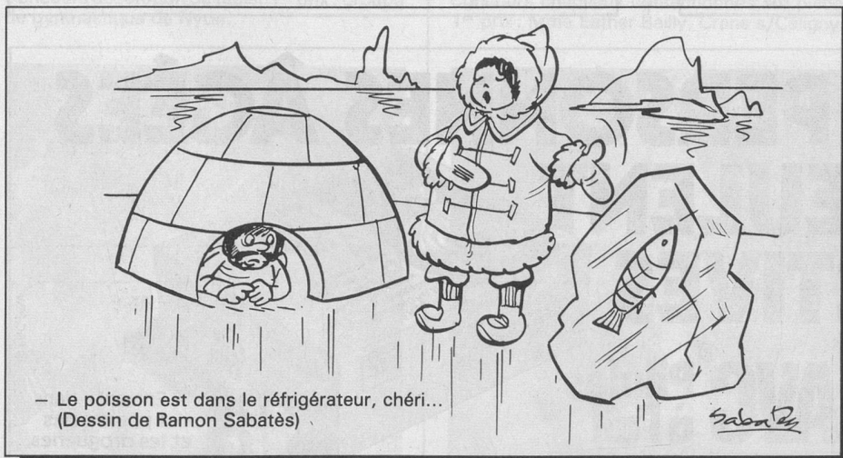
— Le poisson est dans le réfrigérateur, chéri... (Dessin de Ramon Sabatès)