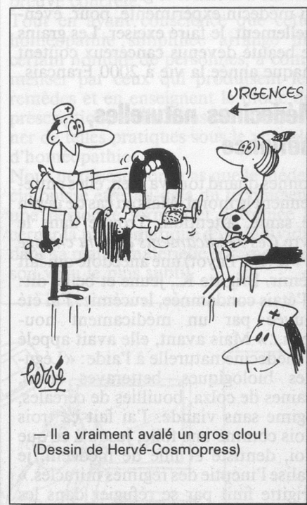
— Il a vraiment avalé un gros clou! (Dessin de Hervé-Cosmopress)