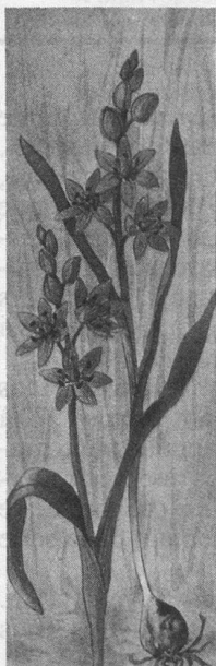
Nivéole Leucojum vernum (Amaryllidées)