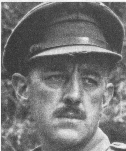
Le Pont de la rivière Kwai — 1957

tant une petite danse ridicule, me rendant compte que ma braguette était ouverte ou même me trompant de théâtre... Malgré toutes les angoisses qu'ils m'avaient procurées dans la journée, les films n'étaient jamais venus troubler mes nuits...» C'est ainsi qu'Alec Guinness, bien qu'il aimât le cinéma, avait, malgré ses cauchemars cette passion pour le théâtre qu'il exprime dans ses Mémoires .