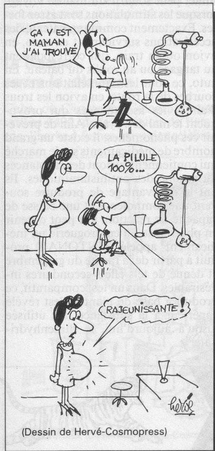
(Dessin de Hervé-Cosmopress)