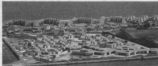
Port Barcarès: le village-vacances L'Estanyot

(Reprise après quelques années d'un séjour fort apprécié et de surcroît avantageux).