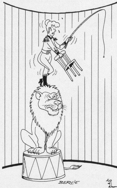
Sans paroles. (Dessin de Bernie-Cosmopress)

Ne pas utiliser ce coupon pour le renouvellement de l'abonnement svp.