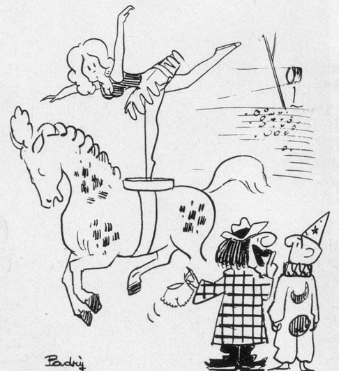
— Dis rien!... J'y fait croire qu'elle l'a oubliée! (Dessin de Padry-Cosmopress)