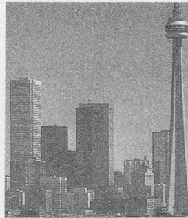
CONTE POUR UN ÉTÉ