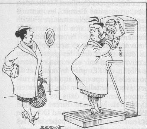
Sans paroles. (Dessin de Bernie-Cosomopress)

Juillet-août-septembre sont les mois de pointe à la campagne pour les morsures de ces acariens parasites du mouton, du chien et de l'homme. Des études menées à Rennes et à Paris, sur 154 cas entre février 1985 et février 1986, révèlent que si la phase primaire est anodine (légère inflammation autour de la piqure), il ne faut pas la négliger car elle peut être suivie, quelques semaines ou mois plus tard, par une paralysie faciale, des douleurs des racines nerveuses, une encéphalite. Les antibiotiques sont efficaces.