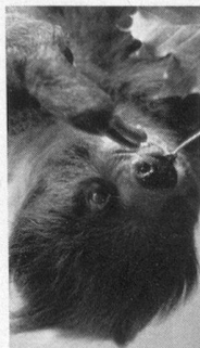
HENRI D'ORLÉANS