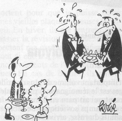
— Aïe! Aïe! Voilà l'addition!... (Dessin de Hervé-Cosmopress)