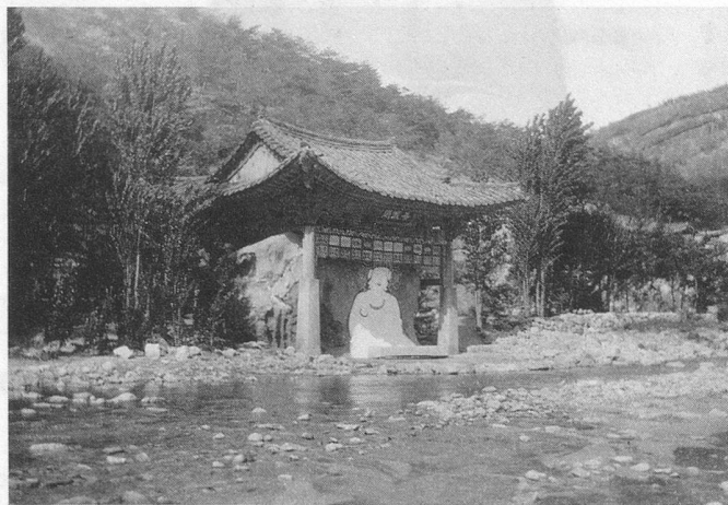
Le temple du Bouddha Blanc

tes dans le fleuve qui coule au bas du précipice, comme une pluie de fleurs humaines explorées par le sort malheureux de leur seigneur et maître. Ainsi persistent les légendes malgré le développement industriel extraordinaire qu'a connu la Corée depuis la dernière guerre mondiale.