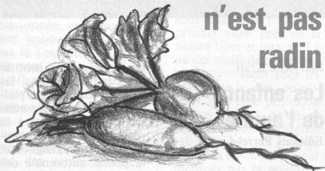
Le radis; la cerise de la terre.