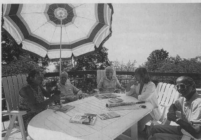
A la recherche du renouveau...