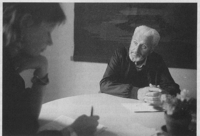
Indispensable pour guérir: le dialogue!