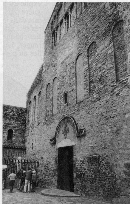
L'Abbaye d'Arles-sur-Tech est la plus ancienne abbaye bénédictine de Catalogne. A gauche, des visiteurs devant le sarcophage.

Au-dessus de la Sainte Tombe, un gisant du XIII e siècle est incorporé au mur. Le personnage sculpté représen-