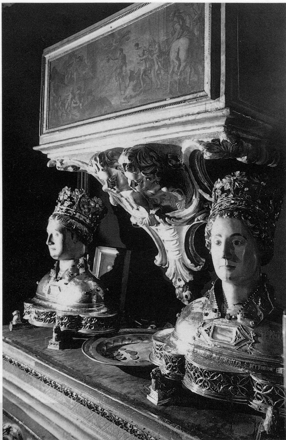
Dans la chapelle qui leur est dédiée, les reliques des saints Abdon et Sennen sont conservées dans des bustes reliquaires du XV e siècle.

La Sainte Tombe que l'on trouve à gauche de l'entrée de l'église abbatiale est un sarcophage monolithe de 1 m 90 de longueur, 60 cm de largeur et 65 cm de hauteur. Ses parois, solides, ont 10 cm d'épaisseur. Un couvercle prismatique en pierre calcaire coiffe le tout. C'est ce lourd cercueil qui recueillit les reliques des deux saints ramenés de Rome par l'abbé Arnulfe. Autre particularité, le sarcophage repose sur deux socles de pierre de 20 cm de hauteur. Il n'y a donc aucun contact direct avec le sol, aucune communication extérieure, ainsi que le relevait déjà en 1793 un procès-