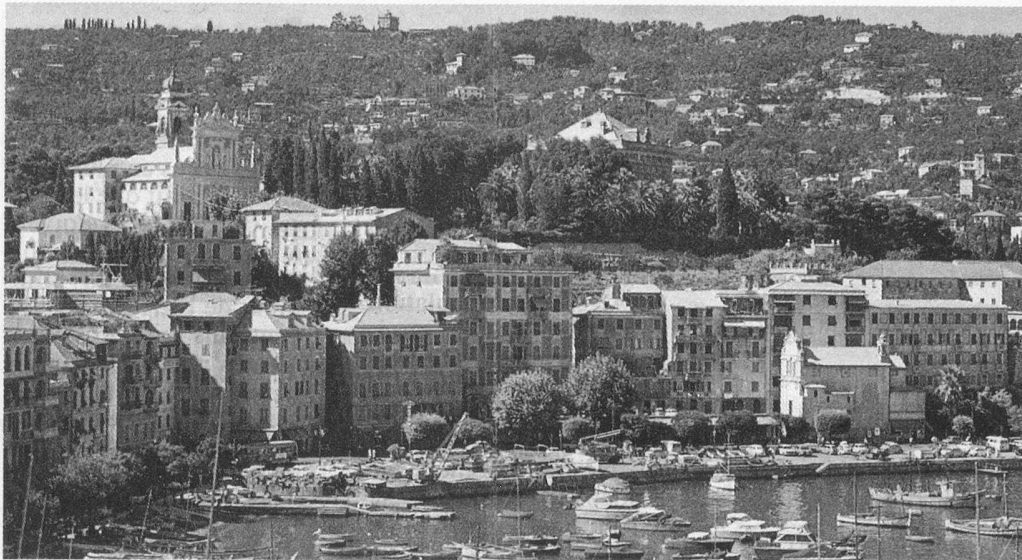
Santa Margherita, Costa del Liguria.