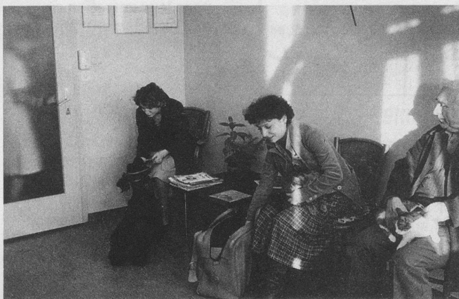
En cas de «découverte» inquiétante, pas d'hésitation: une visite au vétérinaire s'impose.

ses épileptiques, symptômes néphrétiques, phénomènes de coma ou autres dérèglements sérieux. Là encore la quantité des métastases développées aura son importance.