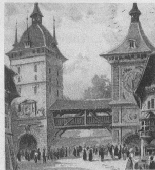
Exposition universelle de Paris. L'entrée du Village suisse.

Dès janvier, un numéro d'ordre bien apparent dut désormais figurer sur les automobiles, afin de permettre aux agents de la circulation de verbaliser contre les chauffeurs trop pressés.