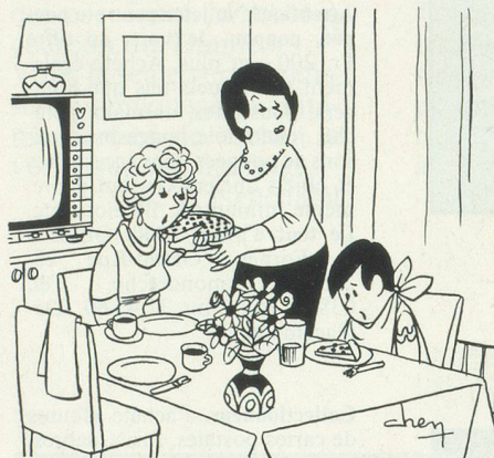
– Qu'est-ce que l'on dit à tante Marcelle? – Le morceau est petit! Dessin de Chen, Cosmopress Genève