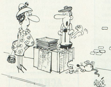
– Les dernières nouvelles ne sont pas bonnes... Dessin de Hervé, Cosmopress Genève.

Ne pas utiliser ce coupon pour le renouvellement de l'abonnement svp.