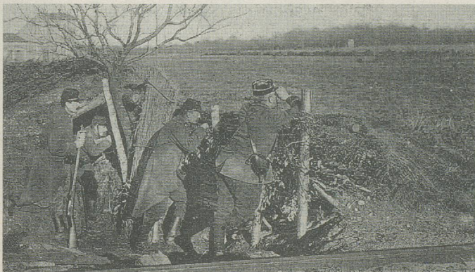
Début de la guerre des tranchées, en février 1915.