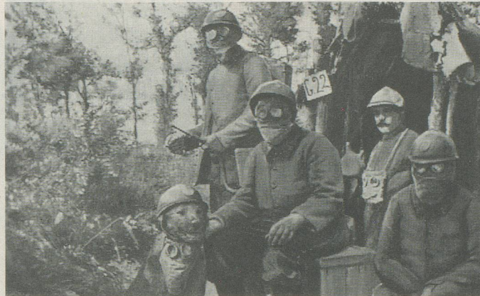
Les gaz toxiques allemands font leur apparition au nord d'Ypres.