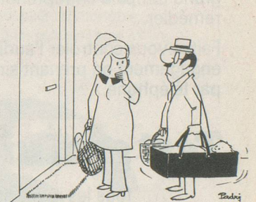
- Mais... Léon!... Ce n'est pas notre cabas de légumes que tu portes dans la main gauche!...