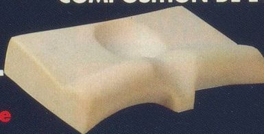
Montage anatomique en mousse aérée. Densité idéale.

Exigez la marque «Oreiller anatomique Anatomia», seule garantie du brevet d'un médecin spécialiste