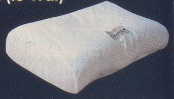
Le tout recouvert d'une housse coton longues fibres anti-allergiques.