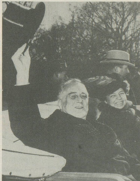
Infirmes à vie mais toujours optimiste, le président Franklin Delano Roosevelt avec son épouse pendant la dernière guerre.

armistice, les Japonais évacuent Shanghai. L'Irak accède à l'indépendance. En juillet, à Lausanne, une conférence économique aboutit à l'abandon des réparations dues par l'Allemagne.