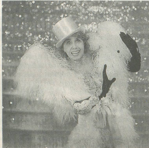
Mistinguett au Casino de Paris en 1937. Elle a 62 ans...

Jean Cocteau a dit d'elle: «Cette tragédienne qui résume notre ville parce que sa voix poignante vient des cris des marchandes de journaux, de la marchande des quatre-saisons»... Tragédienne cette vedette internationale du music-hall doublée d'une exceptionnelle meneuse de jeu? Venant de Cocteau, le mot est puissant, même s'il s'applique à Mistinguett.