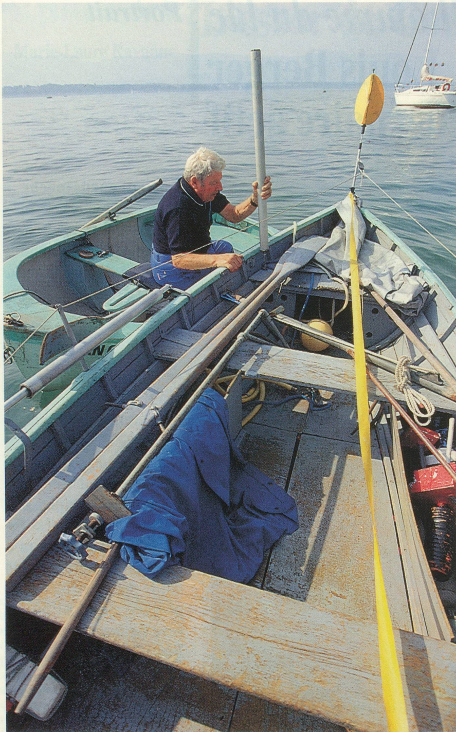
Le bateau est amarré au large afin de prévenir les actes de vandalisme...

La flore du lac a complètement changé à la suite de la grave pollution. En fait, ce n'est pas vraiment nocif pour les poissons, mais bien plutôt pour les oeufs.