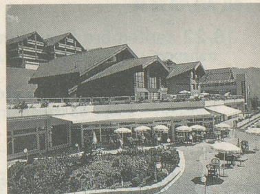
Le centre thermal d'Ovronnaz

Pour vous inscrire: Voyages Berlendis, avenue de la Gare 6, 1003 Lausanne, tél. 021/20 50 45. Mentionnez le voyage d'Aînés à Ovronnaz, tout en précisant votre lieu de domicile. A bientôt sur les hauteurs valaisannes!