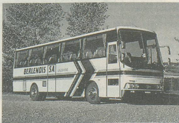
Le car qui vous emmènera sur les hauteurs de la station

Pour vous inscrire: Voyages Berlendis, avenue de la Gare 6, 1003 Lausanne, tél. 021/20 50 45. Mentionnez le voyage d'Aînés à Ovronnaz, tout en précisant votre lieu de domicile. A bientôt sur les hauteurs valaisannes!