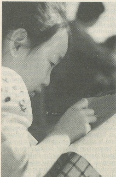
Jeune Pékinoise, au cours de dessin facultatif du dimanche.