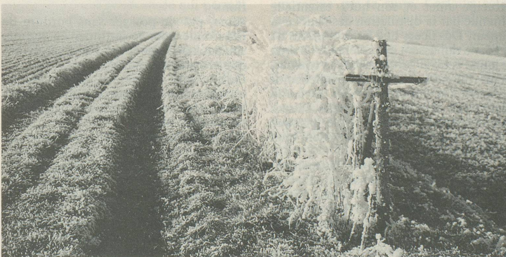
La saison dite morte est la plus arrosée des quatre.

Jardinier occasionnel, amateur sérieux, ou véritable professionnel, «La Grande Encyclopédie des Plantes et Fleurs de jardin» va devenir «votre» guide de référence. Réalisé par la Société royale d'horticulture anglaise, cet ouvrage est bel et bien le plus complet et le mieux illustré jamais publié. En première partie, un catalogue fait le portrait de quelque 4000 végétaux, avec pour chacun une photo aux couleurs fidèles à la réalité. Schématisées, les légendes résument des données aussi primordiales que la taille adulte de la plante, sa forme, etc. Autre qualité exclusive de ce répertoire: il se conjugue selon les couleurs, les hauteurs, ainsi que les intérêts saisonniers des plantes. Résultat: la mise au point rapide d'une base sérieuse pour réussir l'harmonisation de vos plantations. En deuxième partie, un «dictionnaire des plantes» en décrit plus de 6000 avec, en sus, conseils de culture et indications sur maladies et parasites. Bref, un merveilleux outil pour à peine Fr. 100.-.