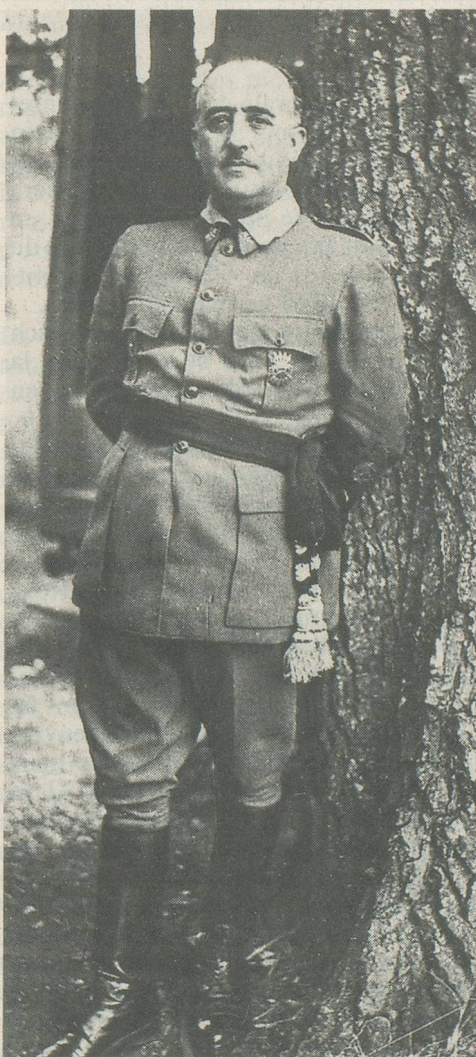
Franco, généralissime. Tous les pouvoirs en ses mains.

Et le 1 er août, Berlin inaugure en grande pompe ses Jeux olympiques. L'Américain Jesse Owens ridiculise la «race supérieure» en raflant à lui seul quatre médailles d'or, parmi lesquelles celle du saut en longueur: 8 mètres 07... ■