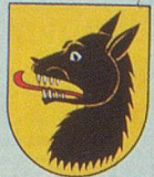
CORBEYRIER les Voleurs de Loup