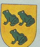
COURNILLENS les Penoillons