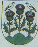
CHARDONNE les Chardonnerets