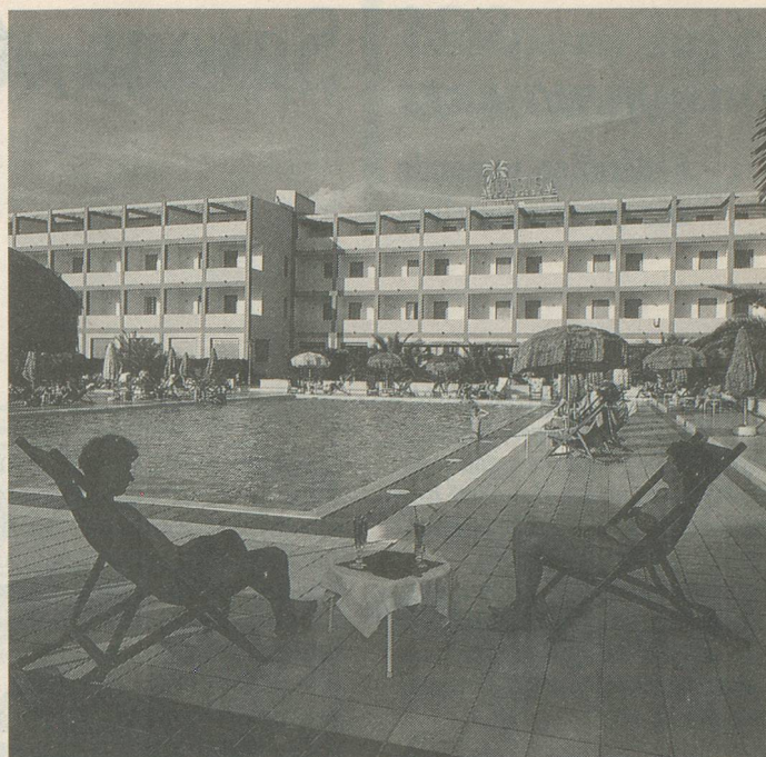
L'Hôtel Oasis et sa grande piscine, à Fertilia-Alghero.