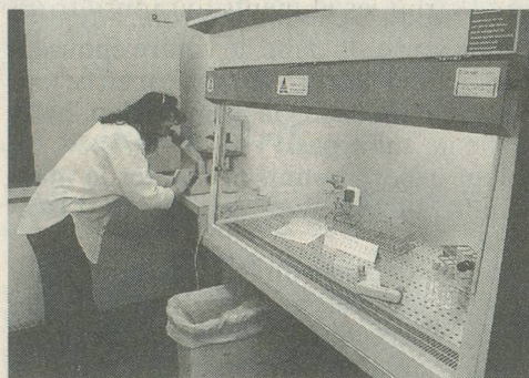
Au laboratoire d'immunologie cellulaire, un travail qui se situe au niveau des molécules.

C'est unique en Europe et c'est à l'hôpital de gériatrie de Genève que cela se passe! Des chercheurs ont ouvert un laboratoire consacré à la biologie du vieillissement. C'est-à-dire que l'on y découvre actuellement nombre d'éléments permettant de savoir comment les cellules de notre corps réagissent avec le poids des ans.