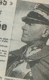
Le général Rydz-Smigly, chef des armées polonaises, est au premier bureau de la mobilisation. Il est vu par le président de Cossat.

Le Conseil des ministres commencé à 10 h. 30 par toute l'armée de l'air française, se déplaçant à 11 h. 20 pour retourner au ministère des Affaires étrangères. Le premier jour de la mobilisation générale est le 2 septembre. Le décret d'habilitation d'état de siège dans la zone de la mobilisation générale est signé dans la nuit du 1 er au 2 septembre. Le décret d'habilitation d'état de siège dans la zone de la mobilisation générale est signé dans la nuit du 1 er au 2 septembre. Le décret d'habilitation d'état de siège dans la zone de la mobilisation générale est signé dans la nuit du 1 er au 2 septembre.