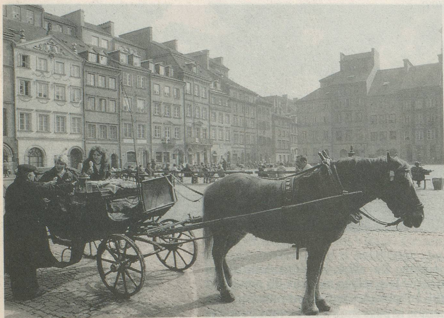
L'admirable place du Marché à Varsovie, un chef-d'œuvre de la reconstruction en Pologne.

Parler de paix, célébrer un génie, un artiste universel: privilège refusé en 1939! Cette année-là est celle de la géhenne. Espagne exceptée, elle connaîtra encore 243 jours de paix relative en Europe. Le 3 septembre, tout basculera.