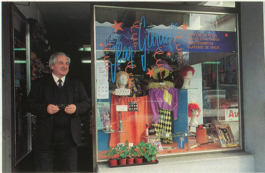
Une boutique, beaucoup de surprises: le Truc'Store.