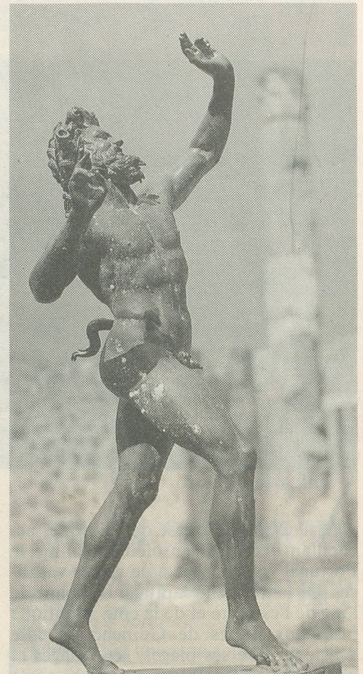
Des vestiges de la civilisation d'antan ont été découverts...

Thermalp les Bains d'Ovronnaz 1911 Ovronnaz Tél. (027) 86 67 67