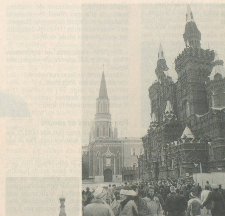
Des bâtiments superbes

Trois fois par semaine, nouveau vol Swissair Genève-Moscou: mercredi, vendredi et dimanche, départ 8 h 40, arrivée 14 h 30 (heures locales).