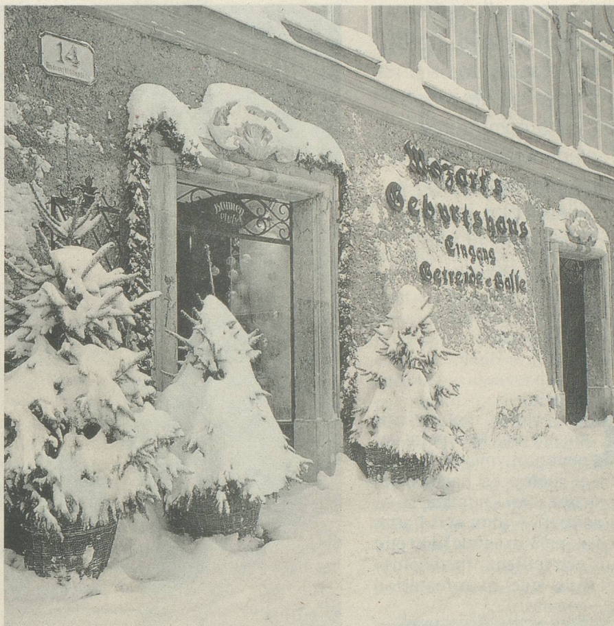
L'entrée de la maison où vécut Mozart dans ses premières années.

Même si, durant l'hiver, les pèlerins-touristes sont moins nombreux, la ville ne s'assoupit jamais. On prétend même que l'atmosphère hivernale est plus «gemütlich». A tel point que la période de l'Avent présente un fort attrait. La réputation des célèbres «Chants de l'Avent» a largement dépassé les frontières du pays et on dit que les gens viennent de très loin pour assister à la «Traversée de l'Avent», durant laquelle on joue des pièces de théâtre, des oeuvres de compositeurs régionaux ou on lit des poèmes de différentes époques.