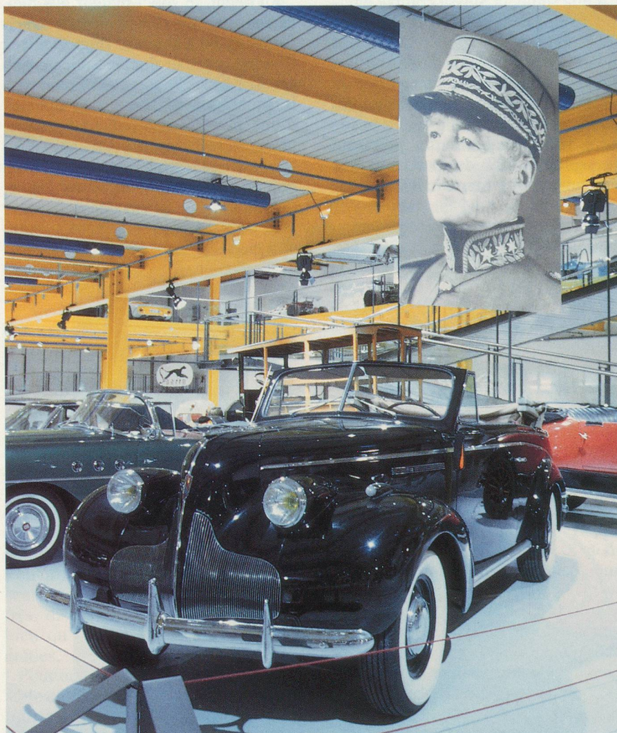
La Buick 1939 du Général Guisan. Cette robuste américaine était montée dans les usines de Bienne