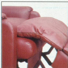
Soutien des genoux en position de relaxation.