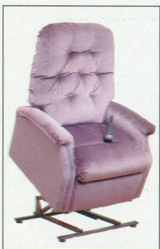
Le «lève-facile» qui vous met debout avec sa télécommande.