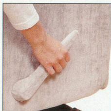
Manette pour actionner le repose-jambes sans effort.