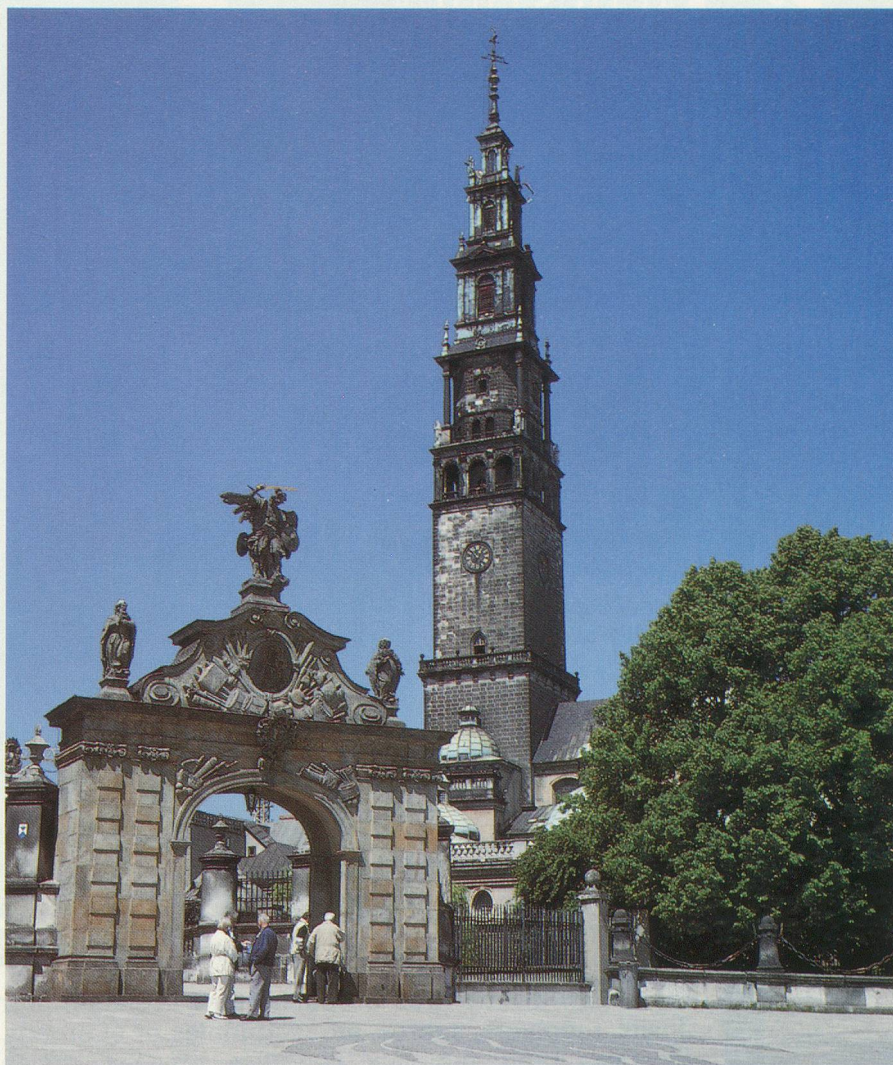
La basilique de Czestochowa surplombe les bâtiments du Couvent des Paulins, le Lourdes polonais

Une randonnée à travers la Pologne ne peut qu'être rythmée par les cris et les chuchotements d'une Histoire à la fois dure et généreuse pour un pays pétri de traditions séculaires. C'est ainsi que je me retrouvai à Malbork, plus connu sous son nom allemand de Marienburg, l'ancienne capitale de l'Ordre des Chevaliers teutoniques. Suivant leurs traces dans leur progression vers l'Est, au cours de laquelle leur Grand-Maître fut tué au 15 e siècle, et pour me faire une idée de la Mazurie et de ses mille lacs, une région paradisiaque pour les amoureux de