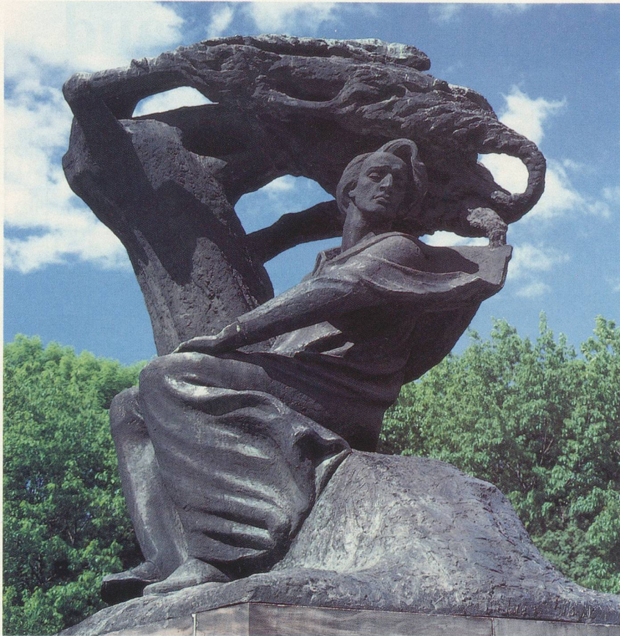
Dans le parc de Łazienki, au cœur de Varsovie, un monument rappelle la mémoire de Frédéric Chopin