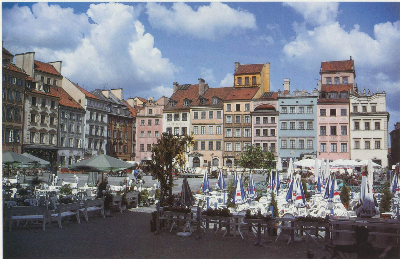
La place du marché de Varsovie. Une quarantaine de demeures bourgeoises des 16 e et 18 e siècle donnent une touche colorée

«Nie damy sie – Nous ne nous laisserons pas faire!» – tel fut le mot d'ordre des Polonais pour résister à Hitler qui avait décidé de radier Varsovie de la carte du monde. Il arriva d'ailleurs presque à ses fins. Détruite à 90 %, la ville a été reconstruite fidèlement, telle que le peintre vénitien Canaletto l'avait dessinée entre 1768 et 1780 pour le roi Poniatowski.