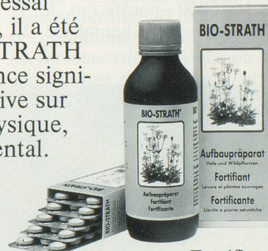
Fortifiant Levure et plantes sauvages

BIO-STRATH efface la fatigue, renforce les capacités de rendement et accroît la vitalité. Au cours d'un récent essai scientifique contrôlé, il a été constaté que BIO-STRATH exerce une influence significativement positive sur le rendement physique, psychique et mental.