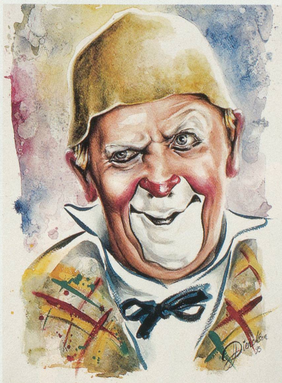
Grock vu par Laurent Diercksen

que j'avais juste la place pour y poser ma chaise. Ce soir-là, les employés de la piste avaient mis le piano de telle façon qu'il occupait la moitié du plancher; deux pieds de la chaise reposaient sur le tapis-brosse, les deux autres sur le plancher. Il me fallait choisir entre deux solutions: ou recu-