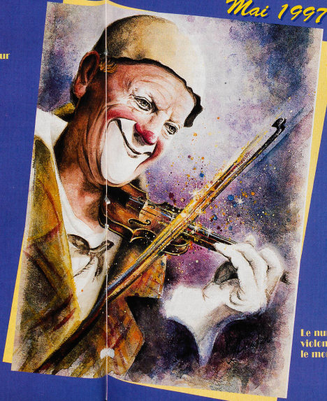
Le numéro du petit vicin, célèbre dans le monde entier.