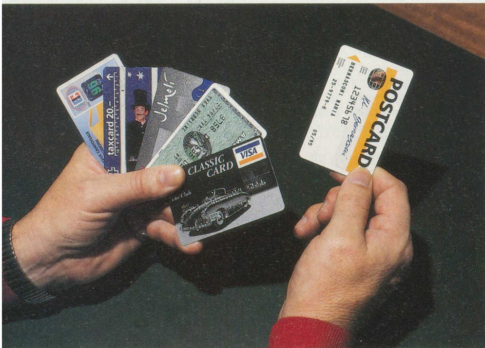
De nombreux atouts dans votre jeu de cartes...

Le compte jaune ouvert, il s'agit maintenant d'apprendre à l'utiliser.