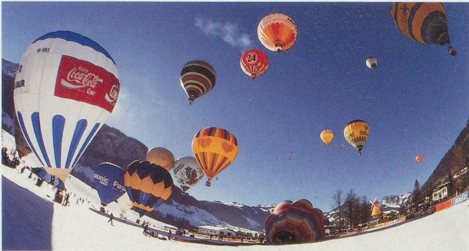
Château-d'Œx, rendez-vous des aérostats