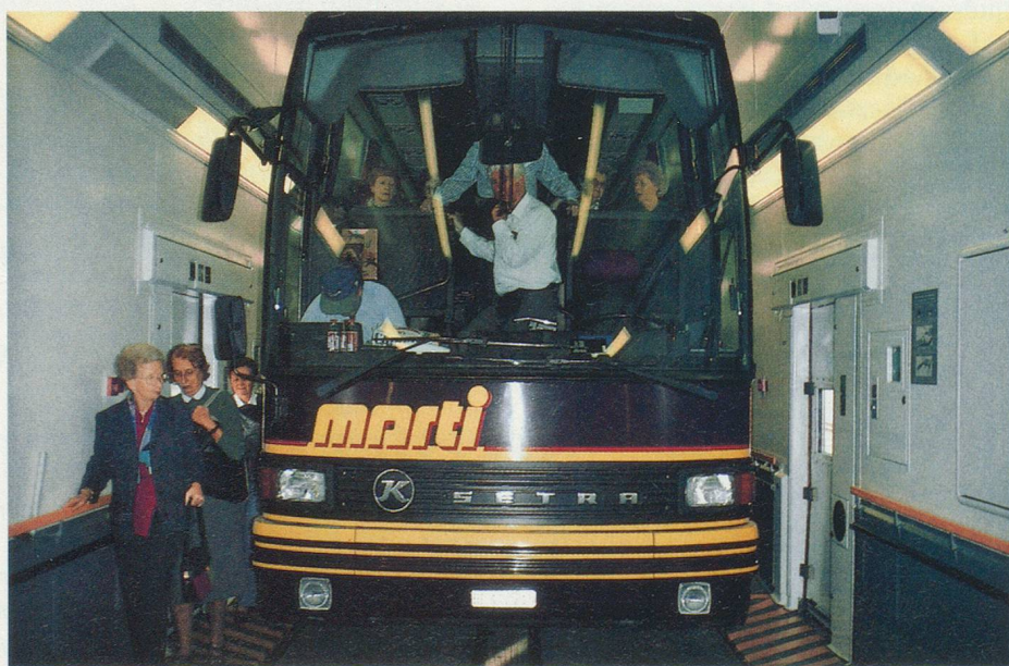
Les wagons englobent cars, voitures et camions pour traverser l'Eurotunnel

Là aussi il y a de quoi s'émerveiller. A commencer par le tablier central taillé en aile d'avion inversée et qui détient un record mondial, avec ses 865 mètres de portée. Des