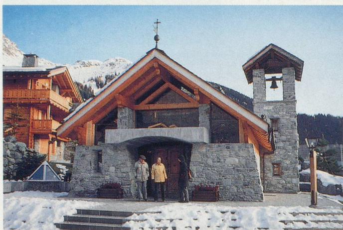
La chapelle de Tous-les-Saints, au cœur du Hameau

Que ce soit en train, via Martigny-Le Châble, en télécabines ou par la route, l'accès à Verbier est relativement aisé. Cette station doit sa réputation au dynamisme de ses promoteurs. Songez: en 1928, les mayens de Verbier comptaient... trois habitants. Aujourd'hui, au plus fort de la saison, ils sont plus de 30 000 à se marcher sur les spatules.